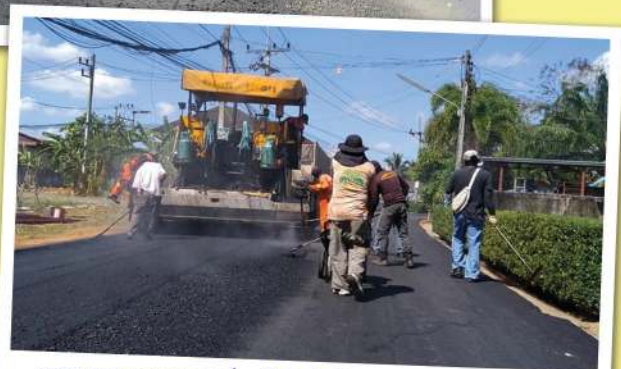
เทศบาลนครสุราษฎร์ธานีเร่งดำเนินการซ่อมแซมปรับปรุงเสริมผิวจราจรแบบแอสฟัลต์ติกคอนกรีต ถนนปทุมพร ถนนร่วมพัฒนา ถนนไฉลกรัฐ ซอย 8 โดยวิธีการจัดซื้อวัสดุแอสฟัลต์ติกคอนกรีตและดำเนินการปูผิวจราจรด้วยรถปูแอสฟัลท์งานสาธารณูปโภค ส่วนการโยธา สำนักงานช่าง