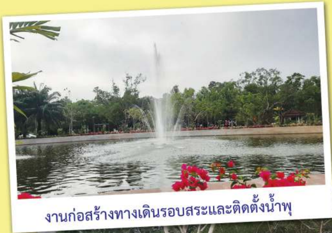
งานก่อสร้างทางเดินรอบสระและติดตั้งน้ำพุ