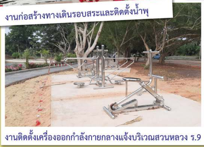
งานติดตั้งเครื่องออกกำลังกายกลางแจ้งบริเวณสวนหลวง ร.9