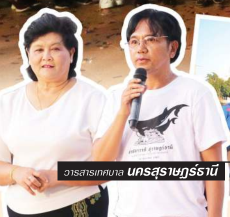
วาทสารเทศบาล นครสุราษฎร์ธานี