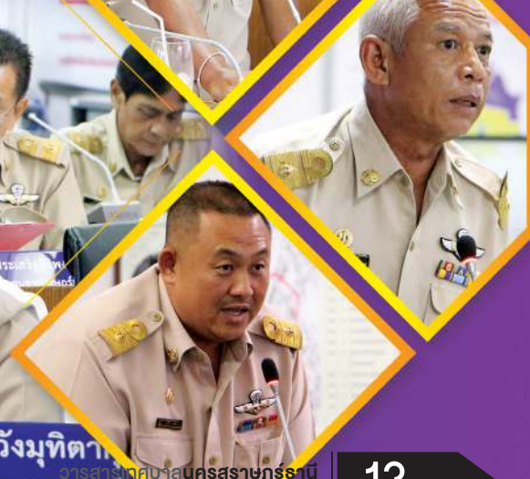
นายธีระกิจ หวังมุทิตา นายกเทศมนตรีเมืองนครราชสีมา