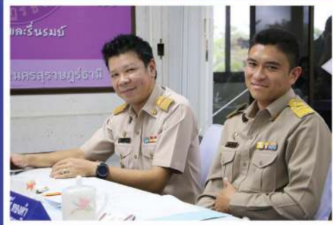
นครราชสีมา นครราชสีมาบุรีรัมย์