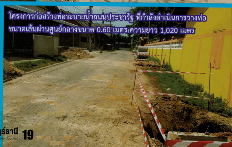
โครงการก่อสร้างท่อระบายน้ำถนนประชารัฐ ที่กำลังดำเนินการวางท่อ ขนาดเส้นผ่านศูนย์กลางขนาด 0.60 เมตร ความยาว 1,020 เมตร