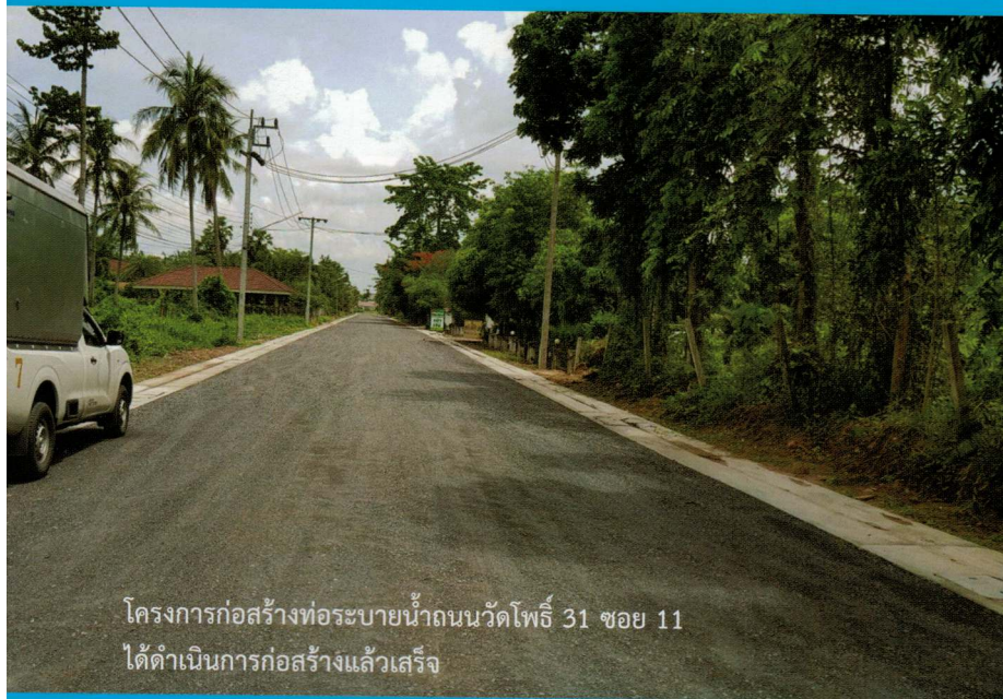
โครงการก่อสร้างท่อระบายน้ำถนนวัดโพธิ์ 31 ซอย 11 ได้ดำเนินการก่อสร้างแล้วเสร็จ

ดำเนินการก่อสร้าง อย่างเช่น โครงการก่อสร้างท่อระบายน้ำถนนกาญจนวนิถี ซอย 37, ถนนกาญจนวนิถี ซอยอุ้งคังดี, ถนนประชารัฐ, ถนนศรีวิชัย 21, ถนนตลาดใหม่ ซอย 3, ถนนพ้อขุนทะเล ซอย 23, ถนนชนเกษม ซอย 20 แยกขวา 1, ถนนวัดกลางใหม่ และอีกหลายโครงการที่อยู่ในขั้นตอนการจัดซื้อจัดจ้าง ซึ่งส่วนช่างสาขาภิบาล สำนักการช่าง ได้เร่งรัดให้ผู้รับจ้างดำเนินการเพื่อให้แล้วเสร็จตามแผนงานที่ได้วางไว้