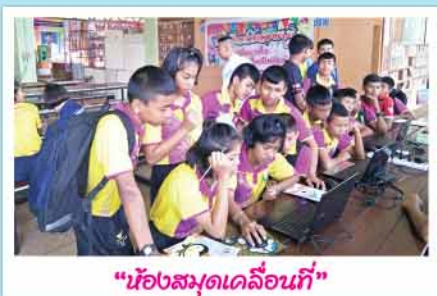
“ห้องสมุดเคลื่อนที่”

งานห้องสมุดฯ สำนักการศึกษา จัดทำโครงการห้องสมุดเคลื่อนที่ออกให้บริการ แก่เด็ก เยาวชน ประชาชน หน่วยงาน และชุมชนต่างๆ ได้ใช้บริการศึกษาค้นคว้า สร้างนิสัยรักการอ่าน โดยจัดบริการหนังสือ สื่ออินเทอร์เน็ตในรูปแบบการบริการเชิงรุก โดยในเดือนมกราคม 2561 มีการจัดกิจกรรมตามโรงเรียนและชุมชนในเขตเทศบาล ตามสถานที่ต่างๆ ได้แก่ โรงเรียนบ้านสันติสุขโรงเรียนอนุบาลสุราษฎร์ธานี โรงเรียน สัมพันธ์ศึกษา โรงเรียนวัดท่าทองโรงเรียนวามินทร์วิทยา (ฮั่วเหมิง) วันเด็กแห่งชาติ ณ สำนักงานเทศบาลนครสุราษฎร์ธานี โรงเรียนเทศบาล ๑ (แดงอ่อนเผดิมวิทยา)