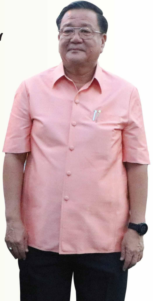
(นายธีระกิจ หวังมุทิตากุล) นายกเทศมนตรีนครสุราษฎร์ธานี

นอกจากนี้ ในด้านความเป็นเลิศของการศึกษา การกีฬา ซึ่งเทศบาลนคร สุราษฎร์ธานีได้รับชัยชนะและได้รางวัลการแข่งขันมากมาย สิ่งเหล่านี้ ผมและ คณะผู้บริหารได้ทุ่มเทเพื่อสร้างชื่อเสียงให้แก่นครสุราษฎร์ธานีมีคนเข้ามาเที่ยวชม อย่างไม่ขาดสาย อันจะส่งผลไปถึงความอยู่ดีกินดี เศรษฐกิจที่ดีขึ้นของชาว นครสุราษฎร์ธานีด้วยครับ ทุกสิ่งที่ผมได้ดำเนินการให้นี้ ถ้าปราศจากความร่วมมือ ร่วมใจจากข้าราชการ พนักงานเทศบาลนครสุราษฎร์ธานีทุกท่านตลอดจน พี่น้อง ชาวนครสุราษฎร์ธานีที่คอยให้คำแนะนำ และสนับสนุนกิจกรรมด้วยดีตลอดมา ผมขอให้ปี 2561 นี้เป็นปีแห่งความสุขของชาวนครสุราษฎร์ธานีทุกท่าน