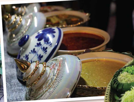
ข้าวยาสมุนไพรแม่มาลี