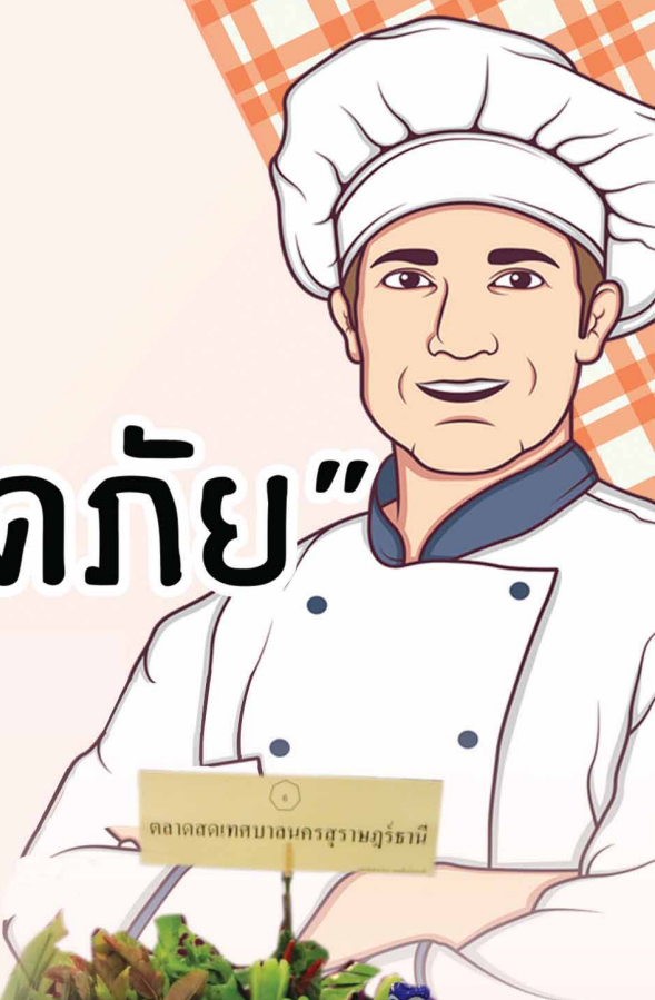
ตลาดสดเทศบาลนครสุราษฎร์ธานี