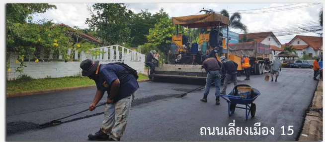
ถนนเลี้ยวเมือง 15