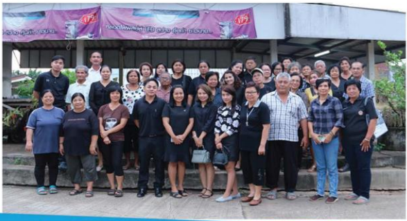
ประชุมประชาคม ชุมชนสนามกีฬา