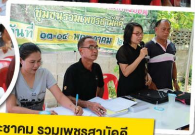
ประชุมประชาคม รวมเพชรสามัคคี