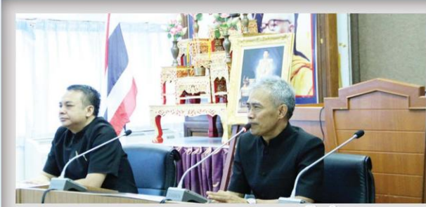
ท.น.ส. ร่วมต้อนรับผู้ว่าฯ ลงพื้นที่ พบปะหัวหน้าส่วนราชการ