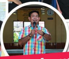
ประชุมประชาคม ชุมชนโพธิราชวาส