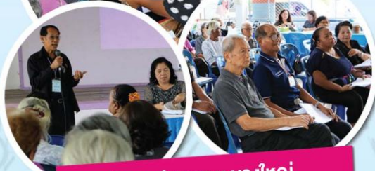
ประชุมประชาคม บางใหญ่