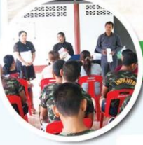
ประชุมประชาคม กองพันทหารราบ 25