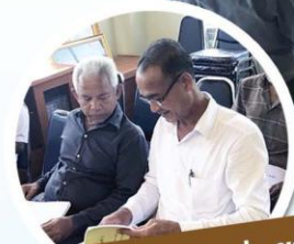
ประชุมประชาคม ชุมชนในลี้ก