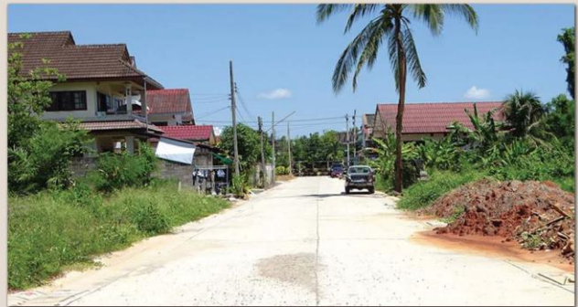
โครงการก่อสร้างท่อระบายน้ำและผิวจราจร ถนนศรีวิชัย 59 (เปรมฤดี 3,7 และ 9) โดยทำการวางท่อระบายน้ำ ค.ส.ล. ขนาดเส้นผ่าศูนย์กลาง 0.60 เมตร พร้อมผิวจราจรคอนกรีตเสริมเหล็กหนา 0.15 เมตร