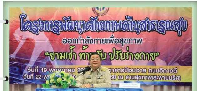
เปิดโครงการพัฒนาศักยภาพด้านสาธารณสุข ออกกำลังกายเพื่อสุขภาพ “ยามเช้า ทักขยับ ปรับร่างกาย”

เมื่อวันที่ 1 มิถุนายน 2560 ณ ห้องแสดงเล็ก NBTสุราษฎร์ธานี นายธีระกิจ หวังมุทิตากุล นายกเทศมนตรีนครสุราษฎร์ธานี ร่วมบันทึกเทปรายการ “NBT วันนี้” ในหัวข้อ “ดอกไม้จันทน์ ทำจากใจถวายพ่อหลวง 99,999 ดอก” โดยมีจิตอาสาและเจ้าหน้าที่ที่เกี่ยวข้อง ได้ร่วมสาธิตการประดิษฐ์ดอกไม้จันทน์ภายในรายการ ซึ่งเทศบาลนครสุราษฎร์ธานีได้จัดกิจกรรมประดิษฐ์ดอกไม้จันทน์ เพื่อแสดงความจงรักภักดี สำนึกในพระมหากรุณาธิคุณ เป็นระยะเวลา 9 สัปดาห์ เริ่มตั้งแต่วันที่ 9 พฤษภาคม - 9 กรกฎาคม 2560 ตั้งแต่เวลา 18.00 - 20.30 น. ณ บริเวณด้านหน้าสำนักงานเทศบาลนครสุราษฎร์ธานี พร้อมขอเชิญชวนพี่น้องประชาชนผู้มีจิตอาสา ร่วมประดิษฐ์ดอกไม้จันทน์ เพื่อใช้ในพิธีถวายพระเพลิงพระบรมศพ พระบาทสมเด็จพระปรมินทรมหาภูมิพลอดุลยเดช ซึ่งสำนักพระราชวังประกาศให้วันที่ 26 ตุลาคม 2560 เป็นวันถวายพระเพลิงพระบรมศพ