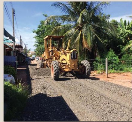
งานซ่อมแซมปรับปรุงถนนภายในเขตเทศบาลนครสุราษฎร์ธานี โดยงานสาธารณูปโภค ส่วนการโยธา สำนักงานช่าง