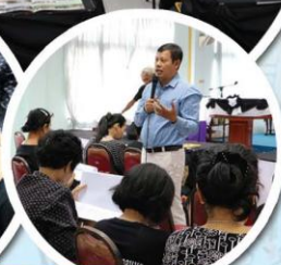
ประชุมประชาคม ตลาดใหม่ดอนนก สหกรณ์ครู