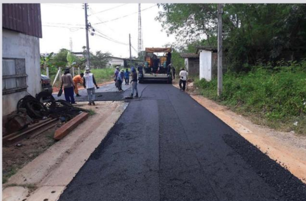
งานปรับปรุงผิวจราจรแบบแอสฟัลท์ติกคอนกรีต ถนนวัดโพธิ์ ซอย 24