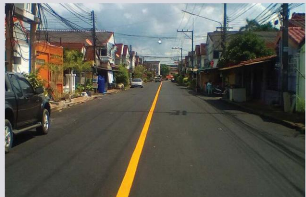
งานปรับปรุงผิวจราจรแบบแอสฟัลท์ติกคอนกรีต ถนนปากน้ำ ซอย 6 พร้อมติดตั้งจราจร