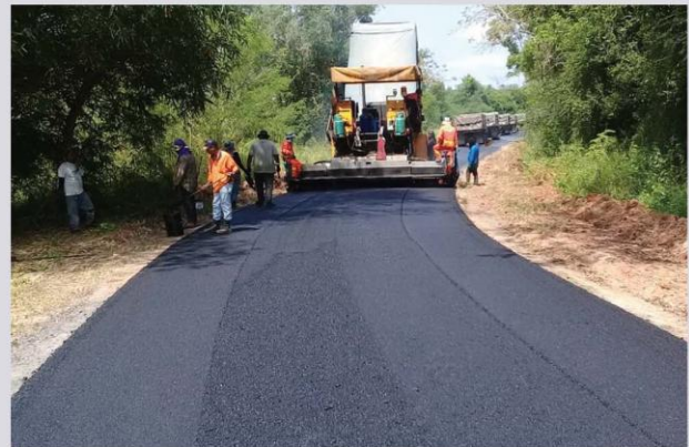
งานปรับปรุงผิวจราจรแบบแอสฟัลท์ติกคอนกรีต ถนนพ่วงทะเล ซอย 25

ถูกต้องตามแบบรูปและรายการรวมถึงขั้นตอนการทำงานด้วย โดยเฉพาะในเขตชุมชนเมืองการจราจรมีความสำคัญในช่วงเร่งด่วน การซ่อมบำรุงจึงจำเป็นต้องวัสดุอุปกรณ์และเครื่องจักรที่ทันสมัย การวางแผนการซ่อมบำรุงจึงมีความจำเป็นอย่างมาก ในช่วงที่ผ่านมาเทศบาลนครสุราษฎร์ธานีได้ดำเนินการซ่อมแซมปรับปรุงผิวจราจรแบบแอสฟัลท์ติกคอนกรีต ในถนนสายหลักและถนนซอยต่างๆ ตามแผนงานที่วางไว้ในปีงบประมาณ 2560 เพื่อให้ประชาชนใช้เส้นทางการจราจรอย่างปลอดภัย