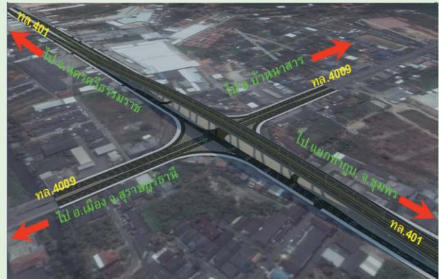
ภาพจำลองสะพานข้ามทางแยกบางใหญ่ บนทางหลวงหมายเลข 401 ที่กำลังจะก่อสร้าง