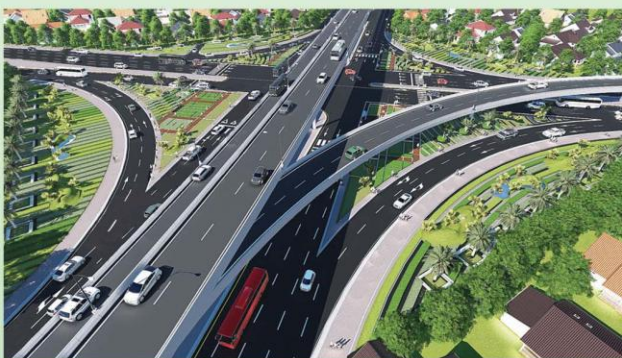
แบบจำลองแยกบางกุ้งที่จะทำการก่อสร้าง