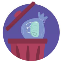
ทึงลงถังขยะ โดยไม่สัมผัส ด้านในของหน้ากากอนามัย