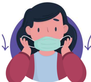
ดึงหน้ากากอนามัย ออกแนวตรง