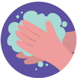
ล้างมือด้วยสบู่ หรือเจลแอลกอฮอล์