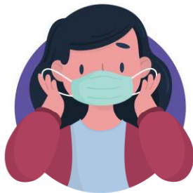
ใช้มือจับสายรัดหู