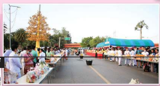
วารสารเทศบาล นครสุราษฎร์ธานี