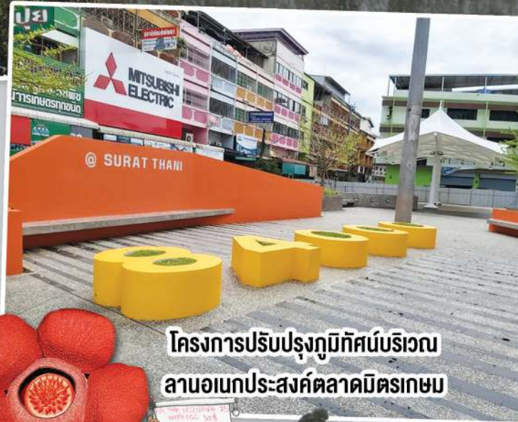
โครงการปรับปรุงภูมิทัศน์บริเวณ ลานอเนกประสงค์ตลาดมิตรเกษม