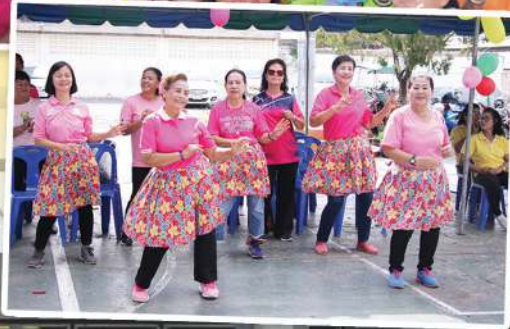
ศูนย์พัฒนาคุณภาพชีวิตและส่งเสริมอาชีพผู้สูงอายุ เทศบาลนครสุราษฎร์ธานี