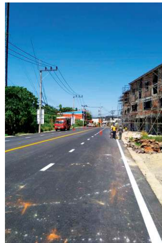
งานตีเส้นจราจรเพื่อสร้างความปลอดภัยโดยงานสาธารณูปโภค ส่วนการโยธา สำนักการช่าง

โครงการติดตั้งเสาไฟฟ้าและชุดโคมไฟ แบบ LED ถนนชุมชน